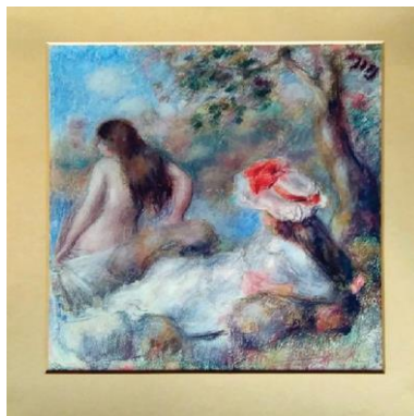
Krivotvorina umjetničke slike Pierre-Augustea Renoira Kupanje , tisak na papiru, 61,5 × 51,5 cm, MP 2721