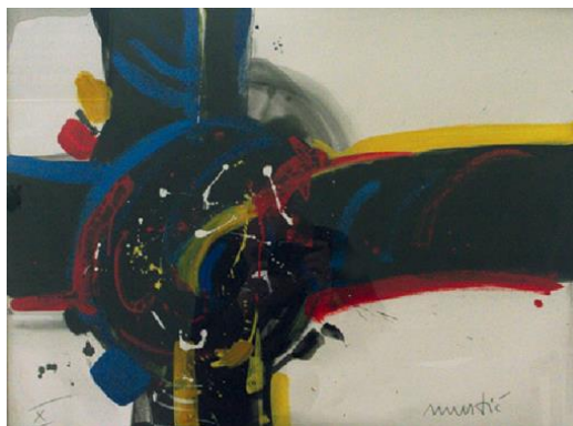
Krivotvorina umjetničke slike Ede Murtića, apstraktni motiv , gvaš, 53,3 × 67,8 cm, MP 2739