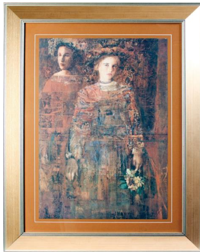
Krivotvorina umjetničke slike Mersada Berbera Portret dviju žena, offset litografija i serigrafija, dimenzije: 76 x 96 cm, MP 2363

Noć muzeja je u potpunosti poprimila karakteristike nezaobilaznog kulturnog događaja, a s ciljem da se potakne daljnje prepoznavanje muzeja kao dinamičnih institucija, koje potiču istraživanje, inovativnost i kreativnost.