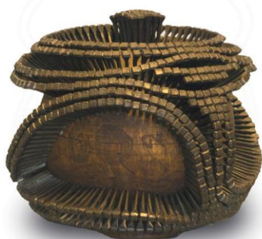
Krivotvorina skulpture Dušana Džamonje Čavli , drvo, željezo, 23 × 23 × 23 cm, MP 2301