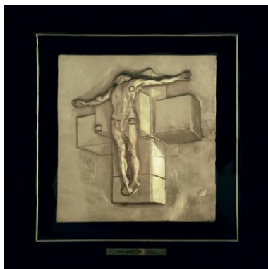
Krivotvorina reljefa Salvadora Dalija Isus na križu , reljef, mjed, 29 × 23 cm, MP 2680