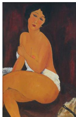
Krivotvorina umjetničke slike Amedea Modiglianija Žena koja sjedi , ulje na platnu, 115 × 85 cm, MP 3033

NA POZIV HRVATSKOG MUZEJSKOG DRUŠTVA GRADSKI MUZEJ SENJ ORGANIZIRA