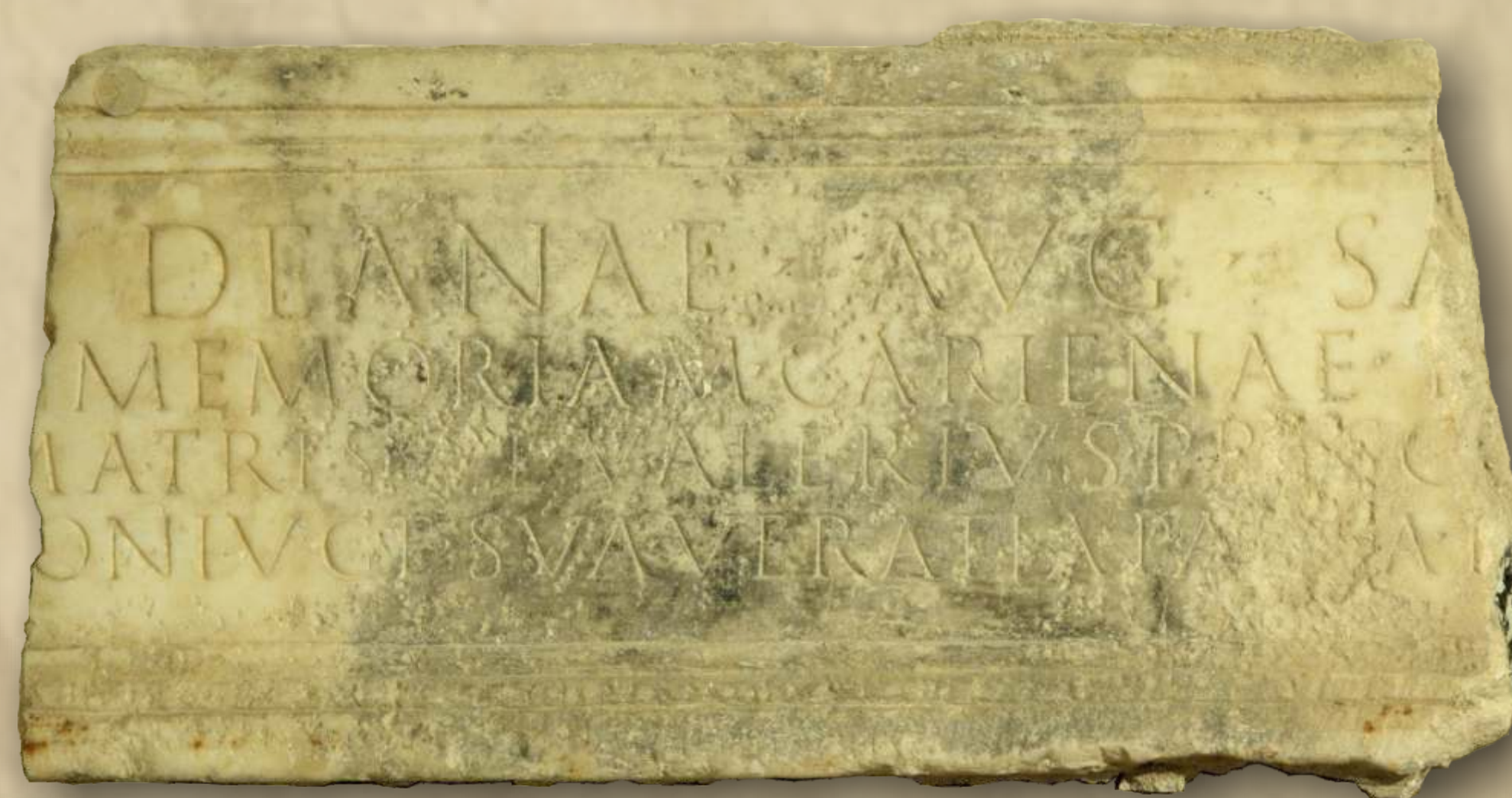
Natpis posvećen božici Dijani, 2. st.