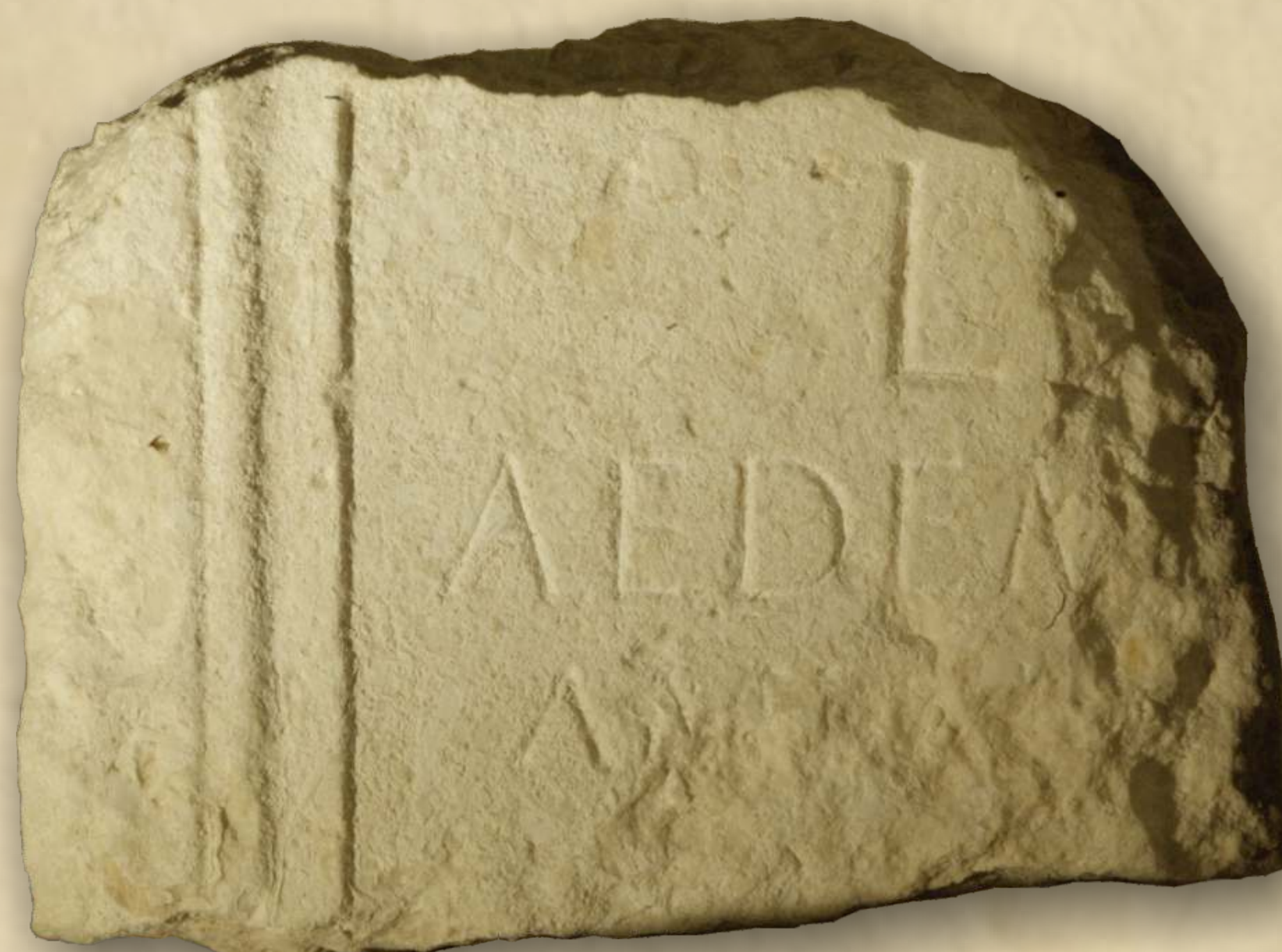
Natpis posvećen bogu Liberu, 2. st.

L[ib(ero) Pat(ri / ...)] / aedem [...] / ampl [iavit ...].