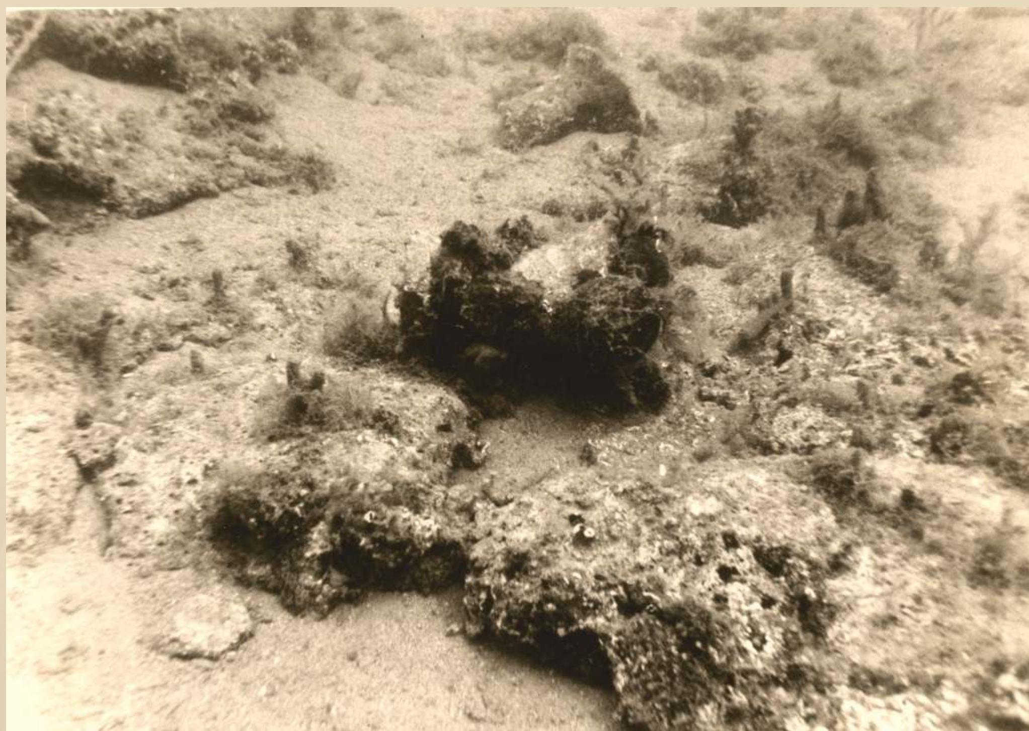
Hidroarheološki lokalitet Dražica kod Donjeg Starigrada