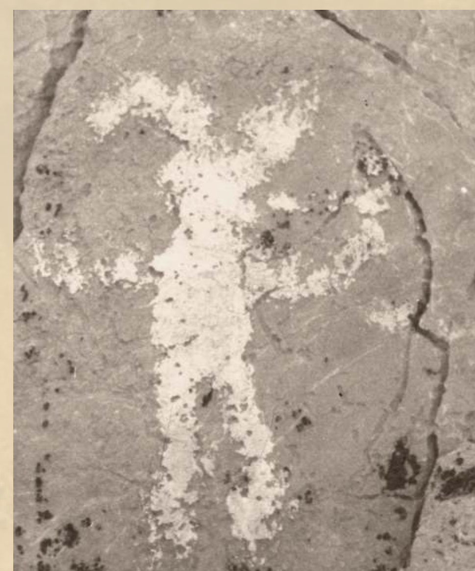
Slikarije pronađene na Lukovačkim gredama - stijenama