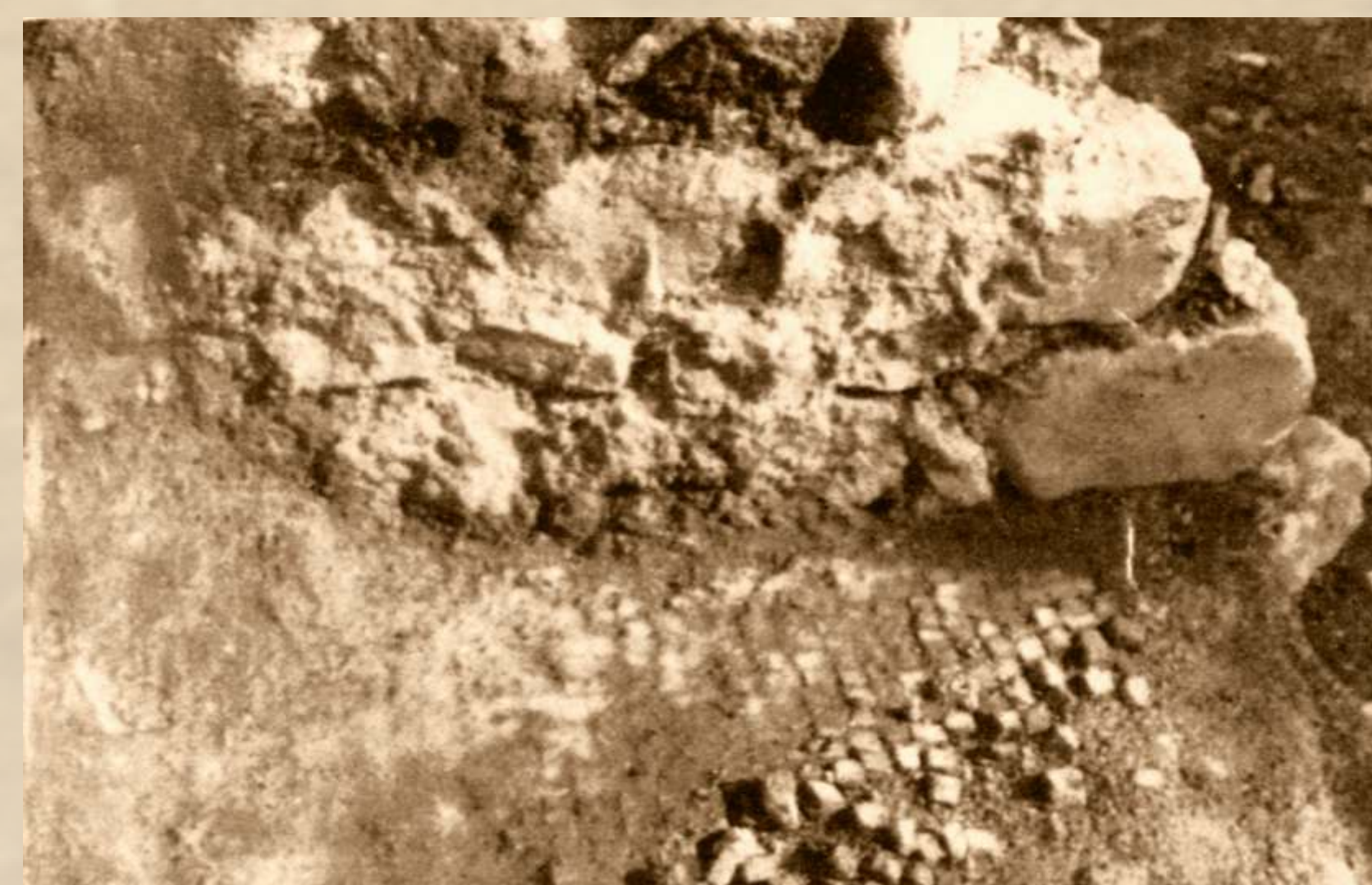
Ostaci zidova i podnice s mozaikom