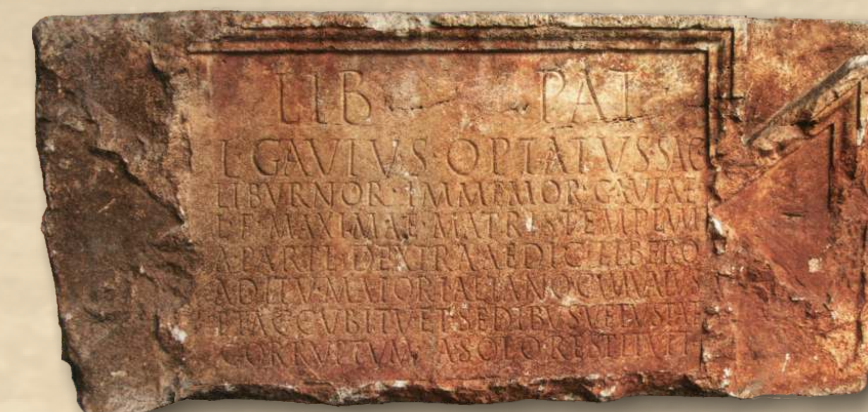
Natpis o obnovi Liberova svetišta, 2. st.

Stojeća figura mladog Libera bez glave i još nekih dijelova kompozicije. Lijevom rukom i lijevom nogom oslanja se na drvo oko kojega se ovija vinova loza, desnom pridržava nebris koji je prepun plodova zrelog voća, a u lijevoj ruci, koja je pružena niz tijelo, drži posudu iz koje izljevina vino.