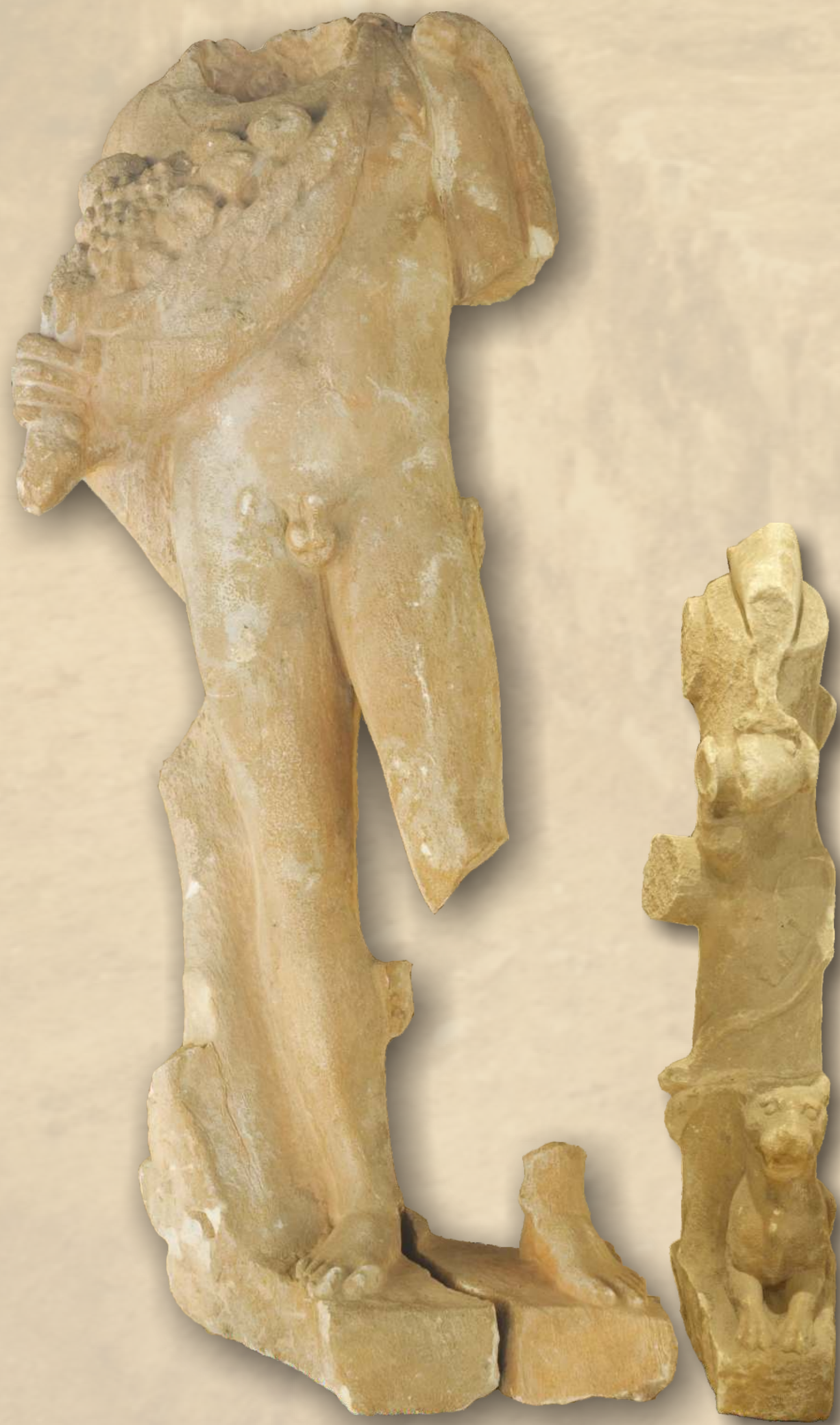
Liber (Dionis), 2. st.

Stojeća figura mladog Libera bez glave i još nekih dijelova kompozicije. Lijevom rukom i lijevom nogom oslanja se na drvo oko kojega se ovija vinova loza, desnom pridržava nebris koji je prepun plodova zrelog voća, a u lijevoj ruci, koja je pružena niz tijelo, drži posudu iz koje izljevina vino.