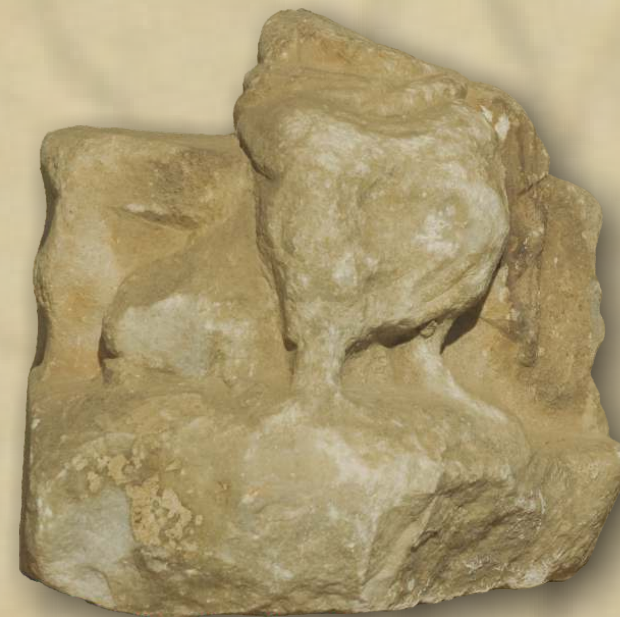
Serapis, 3. st.