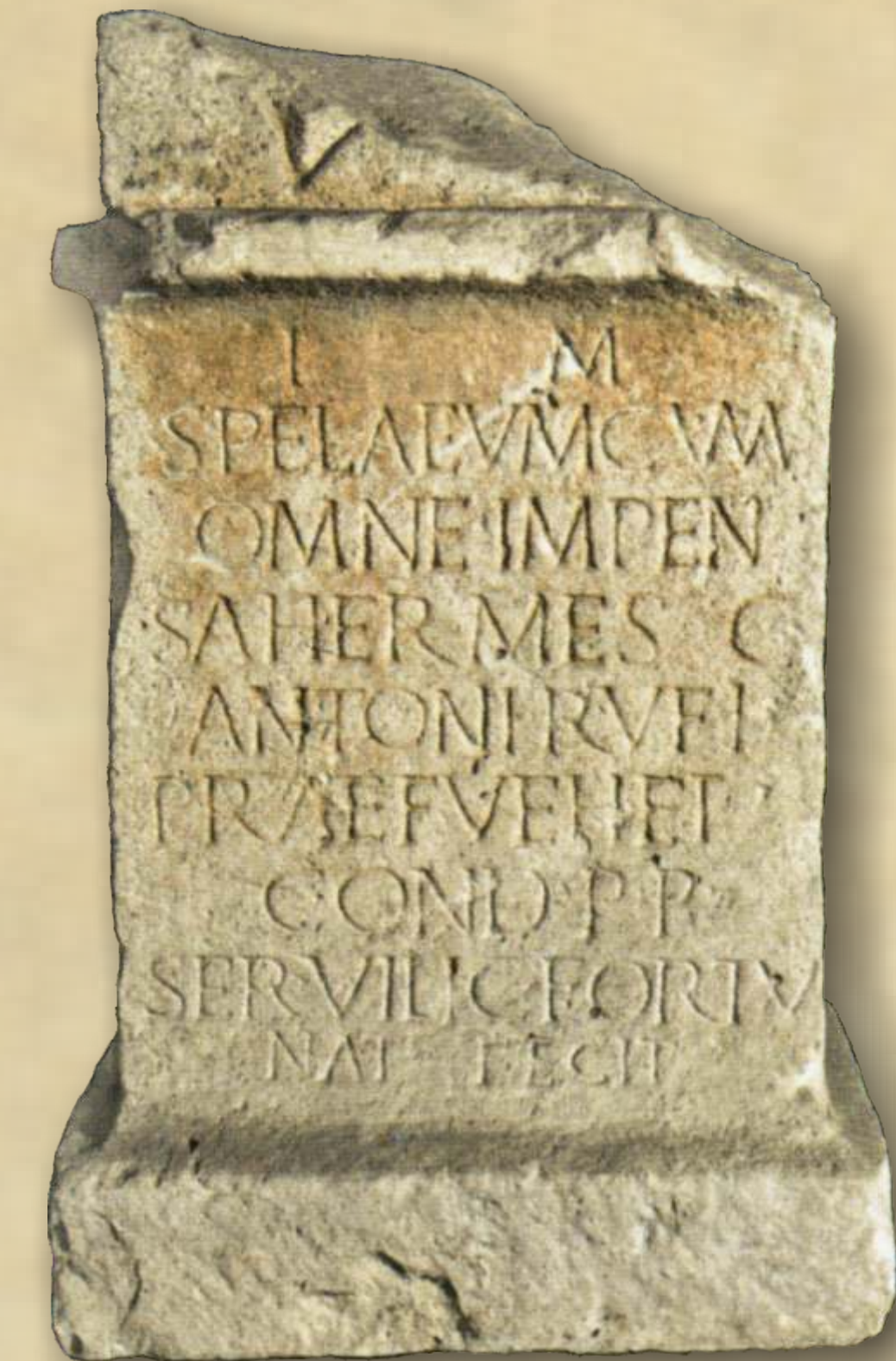
Žrtvenik boga Mitre pronađen na Vratniku 1891. g. Danas se nalazi u Arheološkom muzeju u Zagrebu.