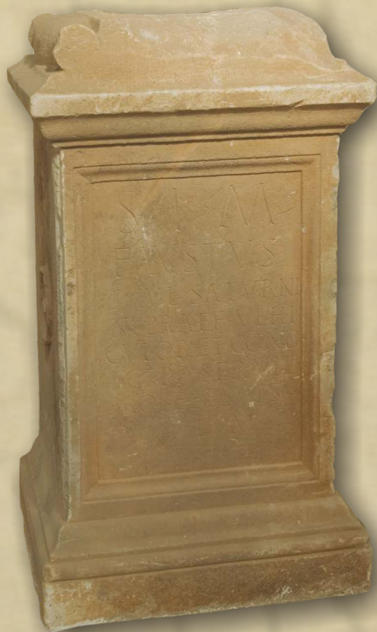
Žrtvenik posvećen bogu Mitri, 2. st.

Pronađen u selu Vratnik 1932. g., 1964. g. prenesen u GMS.