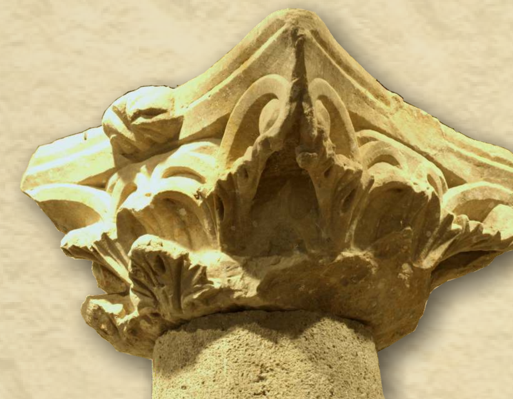
Kapitel korintskog stila