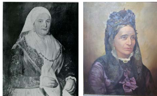
Portreti senjskih građanki, 19.-20. st