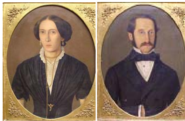
Portreti senjskih građana iz 19. st.