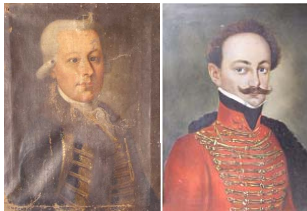
Portreti senjskih građana, 18.-19. st.