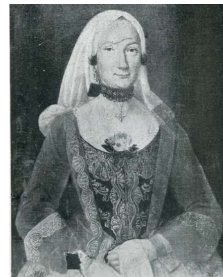
Portret senjske građanke iz 18. st.

Pozivamo Vas da nam se pridružite u Gradskom muzeju Senj u petak, 30. siječnja 2015. godine od 18,00 sati do 01,00 sat poslije ponoći