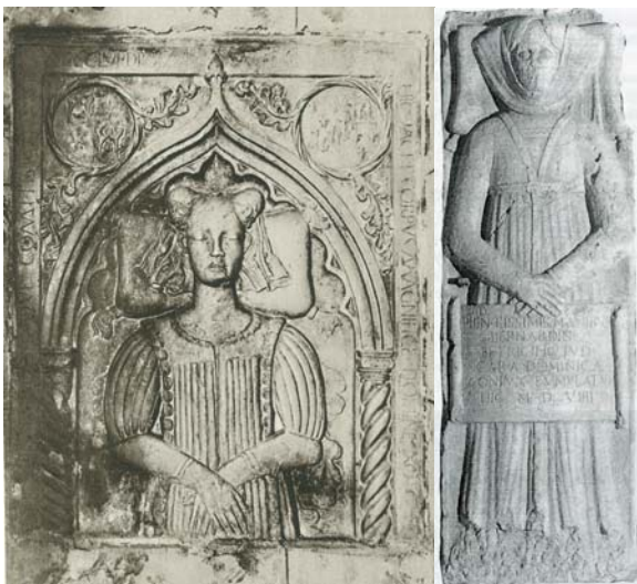
Ižota Frankopanka, 15. st. Dominika Betričić, 16. st.