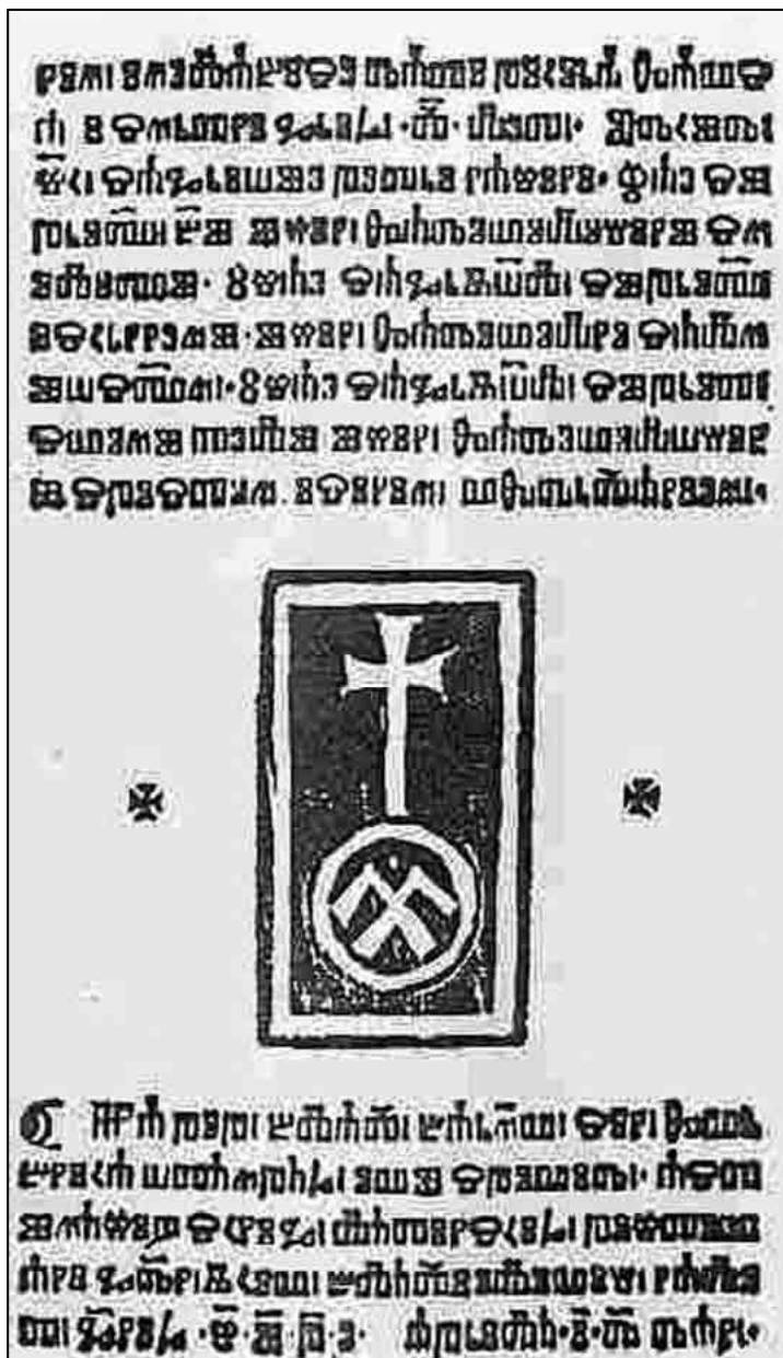
Sl. 1. Spovid općena , kolofon s tipografskim znakom senjske glagoljske tiskare, Senj, 1496. godine, Samostan franjevaca trećoredaca, Ksaver, Zagreb