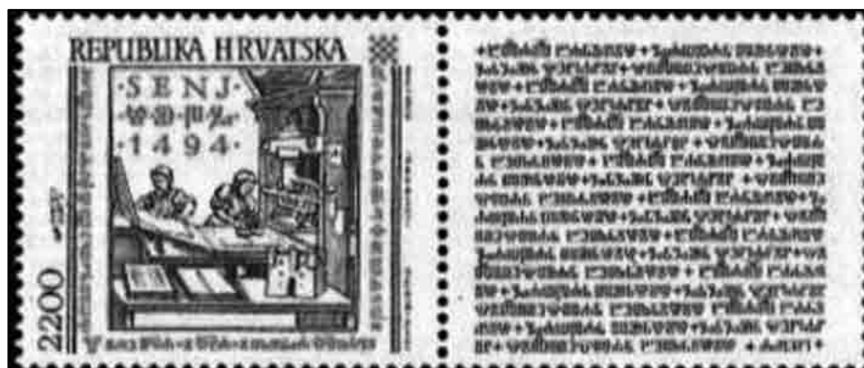
Sl. 3. Poštanska marka povodom 500. obljetnice Senjskoga glagoljskoga Misala 18