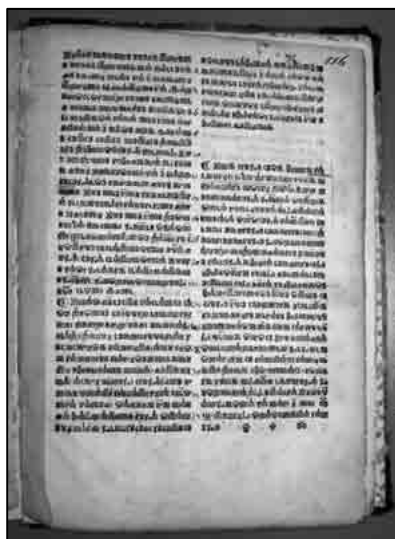
Sl. 5. Naručnik plebanušev , Senj, 1507, Kolofon (Knjižnica HAZU, 118 listova; 8° (18 cm), Sign: R-675, a – prije restauracije) 28