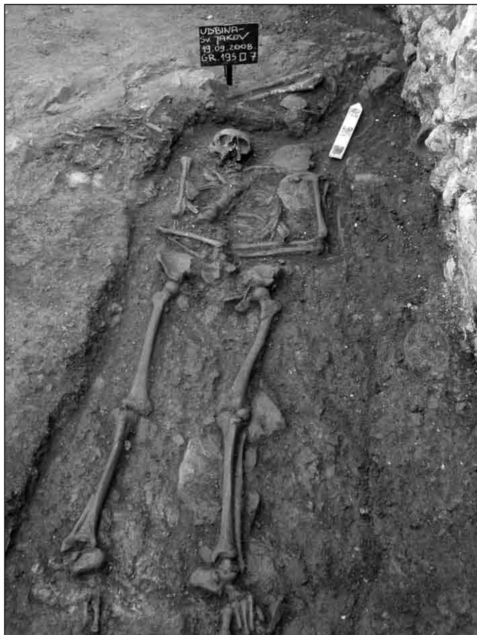
Sl. 2. Udbina-Katedrala, grob 195.