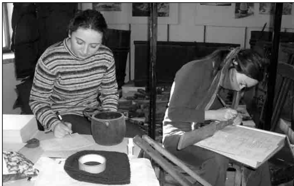
Sl. 1. Inventarizacija etnografske bunjevačke zbirke (foto: Tihana Rubić, studeni 2003.)

Gradskom muzeju Senj za područje etnologije (etnologinja i kustosica Tanja Kocković) i riječkog Konzervatorskog zavoda (etnologinja i konzervatorica Ivana Šarić Žic), na tom su poslu bili angažirani i studenti etnologije i kulturne antropologije Filozofskog fakulteta Sveučilišta u Zagrebu. To su mahom bile studentice završnih godina studija etnologije i kulturne antropologije, ili već diplomirane etnologinje i kulturne antropologinje te uglavnom sudionice etnoloških i kulturnoantropoloških istraživanja na području senjskoga zaleđa, na primorskoj strani Velike Kapele i Velebita. 10 Etnološka istraživanja provodila su se kroz znanstvene projekte pod vodstvom prof. dr. sc. Milane Černelić s Odsjeka za etnologiju i kulturnu antropologiju Filozofskog fakulteta Sveučilišta u Zagrebu. Saznanja koja su korištena za potrebe inventarizacije dobila su se uglavnom tijekom znanstvenog projekta Identiteti i etnogeneza primorskih Bunjevaca 11 koje je financiralo Ministarstvo znanosti, obrazovanja i