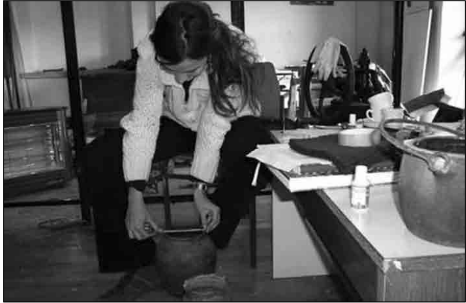
Sl. 2. Mjerenje veličine predmeta prilikom inventarizacije

sporta RH od 2002. do 2007. godine Na taj način studentice etnologije su inicijalno bile upoznate s bunjevačkom tradicijskom kulturom i tradicijskim načinom života na području senjskoga zaleđa i šire, od kraja 19. stoljeća pa sve do sedamdesetih godina 20. stoljeća. 12 Tijekom terenskih istraživanja prikupljani su razni podatci i o samim istim ili sličnim predmetima kakvi se nalaze u Muzeju te o njihovoj primjeni u nekadašnjem svakodnevnom životu. Spoznaje s terenskih istraživanja, a potom i one iz znanstvene i stručne literature, pored postojeće muzejske dokumentacije, bile su temeljna informacija u poslovima muzejske inventarizacije. (Sl. 1-2) Inventarne kartice sadržavale su razne podatke o predmetu: inventarni broj, naziv ustanove, naziv zbirke, opis i stanje predmeta, veličina i težina te broj komada. Potom su slijedili i detaljniji podatci o samom predmetu, tj. "priča" o predmetu, njegova povijest i kontekst njegove uporabe i pronalaska: vrijeme kada je predmet pronađen i prikupljen, nalazište, mjesto izvedbe i mjesto uporabe, okolnosti