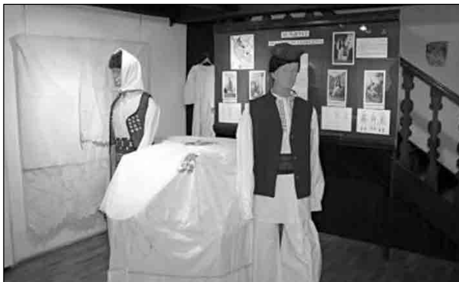
Sl. 7. Dio stalnog postava, lutke u nošnjama.