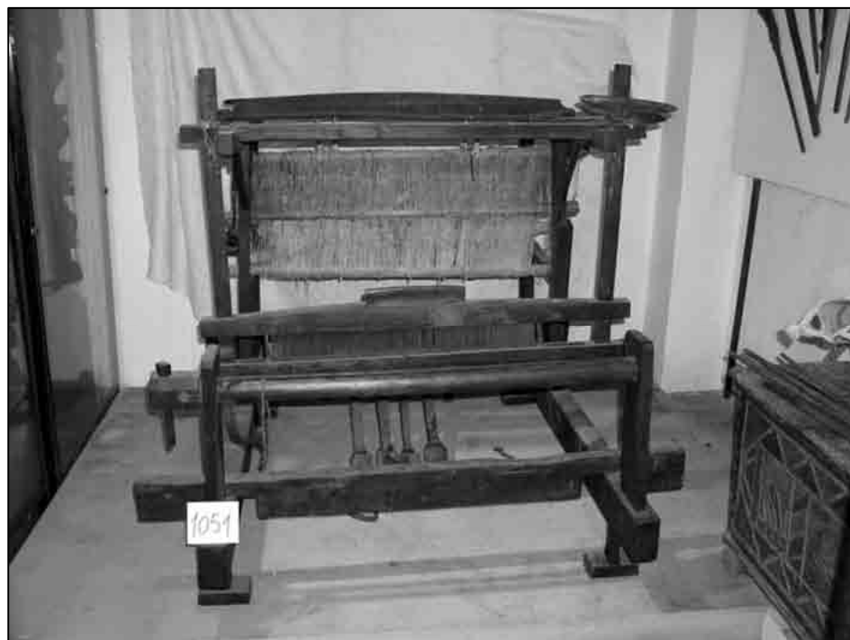
Sl. 4. Inventarizirani predmet – tkalački stan (foto: Tihana Rubić, studeni 2003.)

naposljetku u inventarizaciji uspjele pouzdano pridružiti stari broj, ali mnogima ne. Stoga se odlučilo pristupiti popisivanju i opisivanju svih predmeta koji su se nalazili u Zbirci, s opširnijim opisom i pridruživanjem predmetima novog inventarnog broja. Uz novi broj koji bismo predmetima pridruživale, u zagradi bismo na inventarnoj kartici predmeta navele i stari broj, onaj prema glavnoj inventarnoj knjizi, tada kada bismo taj broj pouzdano mogle prepoznati te predmet po izgledu pouzdano povezati s opisom i brojem u knjizi. 13 (Sl. 4-5) Općenito smo, prilikom inventarizacije, nastojale točno i opširno ispuniti sve rubrike koje se navode na pojedinoj inventarnoj kartici, što ponekad nije bilo moguće zbog nedostatka pojedine informacije o kupovini predmeta ili slično, ali je većina rubrika ipak točno i opširno popunjena.