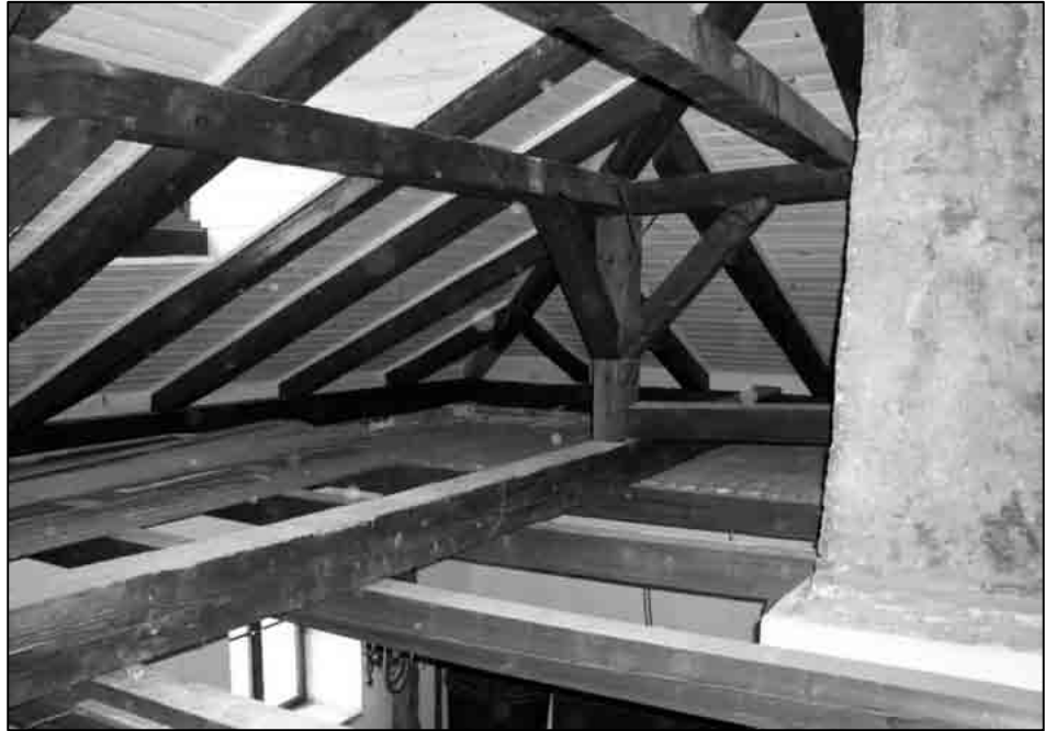
Sl. 6. Priprema, proširenje i uređenje tavanskog prostora za etnografski postav (foto: Blaženka Ljubović, 2003.)