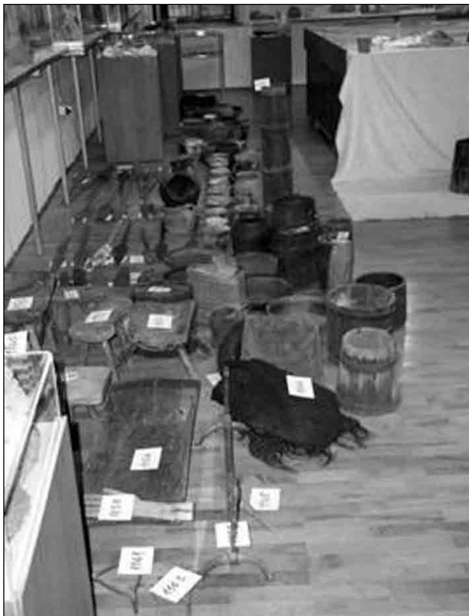
Sl. 5. Razni predmeti koji su inventarizirani i koji će činiti stalan postav Muzeja (foto: Tihana Rubić, studeni 2003.)