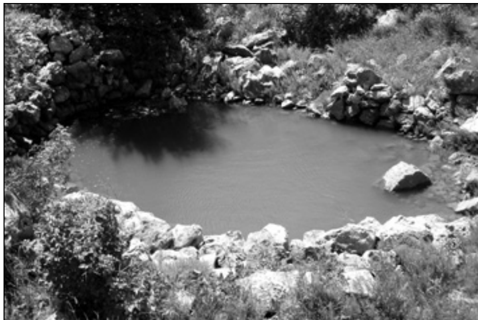
Sl. 1. "Grčki bunar" na Orijama, 18. 5. 2007.