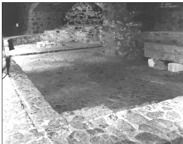
Sl. 1. Temeljni ostatci ranoromaničke crkve sv. Jurja (?) otkriveni unutar tvrđave Nehaj godine 1964.